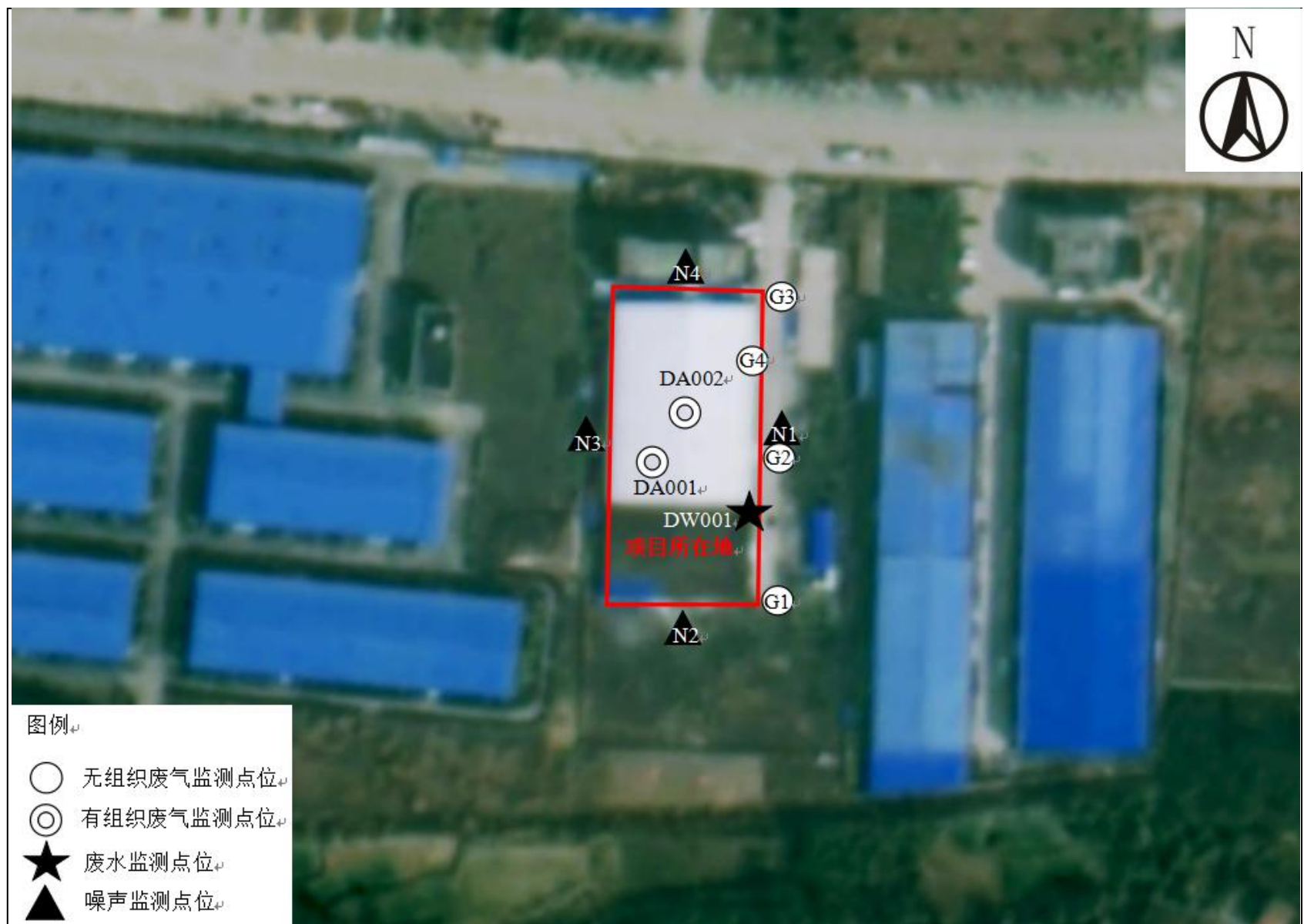
附图 4 项目监测点位图