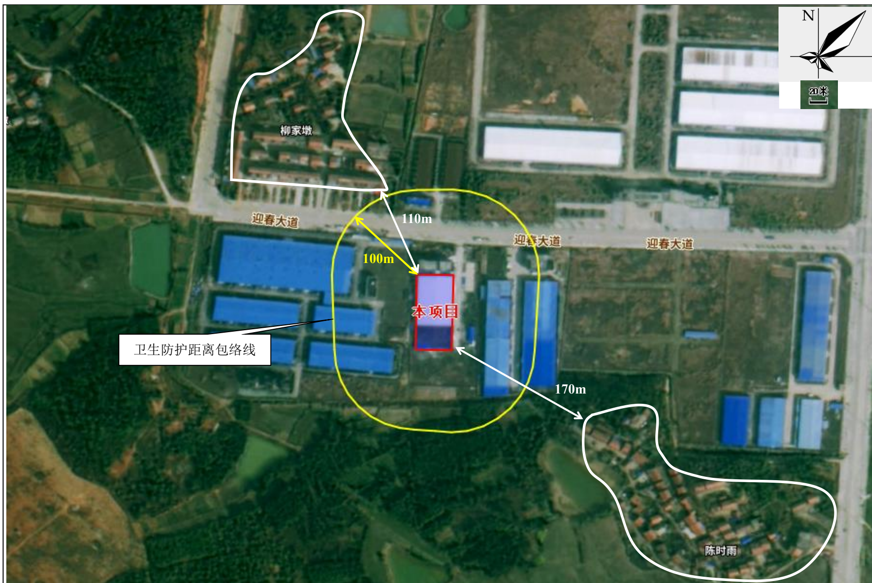
附图5 项目卫生防护距离包络线图