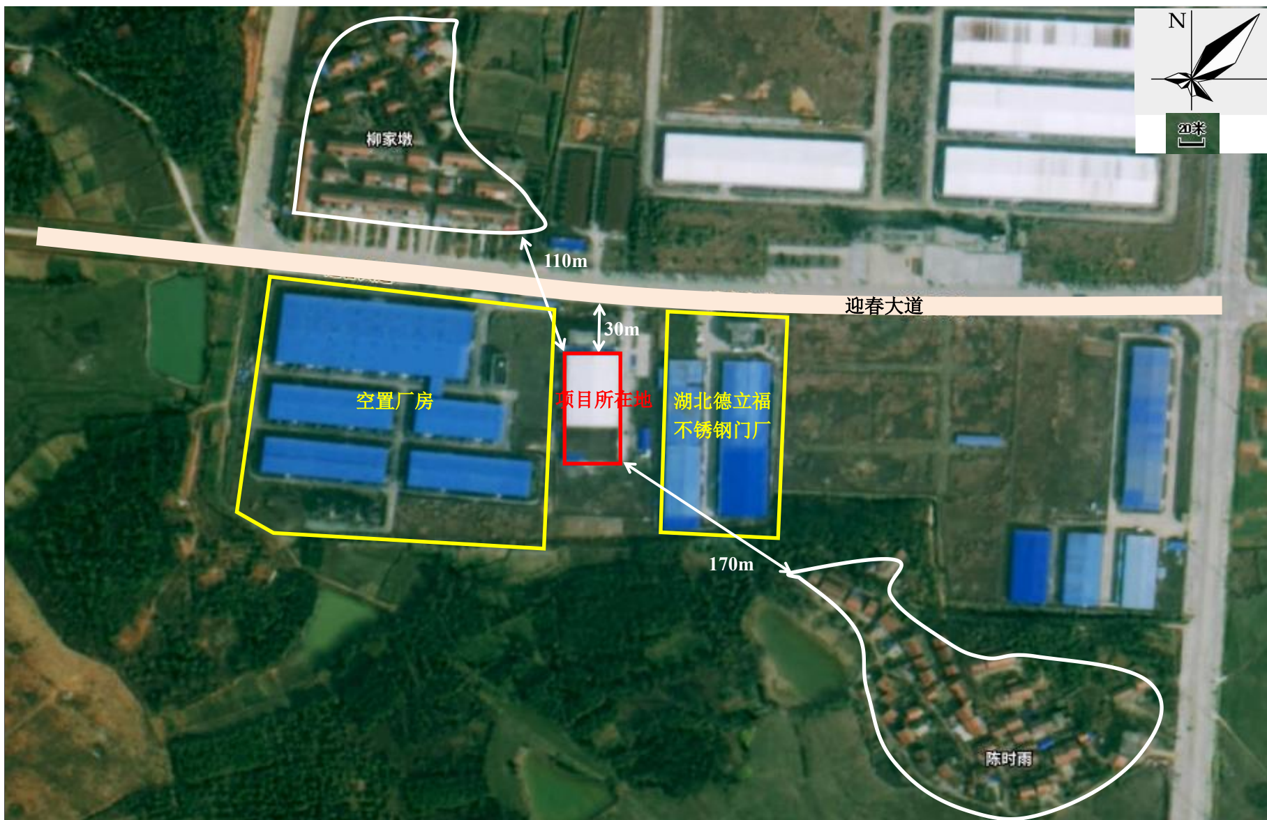
附图2 项目周边关系示意图